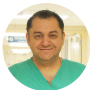
Принимает роды в Memorial Regional Hospital