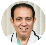
Принимает роды в Memorial Regional Hospital