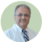
Принимает роды в Mount Sinai Medical Center

Очень внимательный и добрый доктор, все, кто рожает с ней один раз, обязательно возвращаются снова.