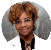
Принимает роды в MEMORIAL MIRAMAR

Сторонник естественных родов, однако, также специализируется на VBAC (естественные роды после кесарева сечения) и на сложных операциях кесарева сечения (третье, четвертое кесарево сечение).