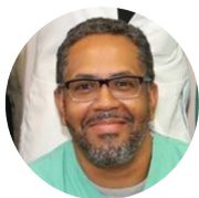
Принимает роды в North Shore Medical Center